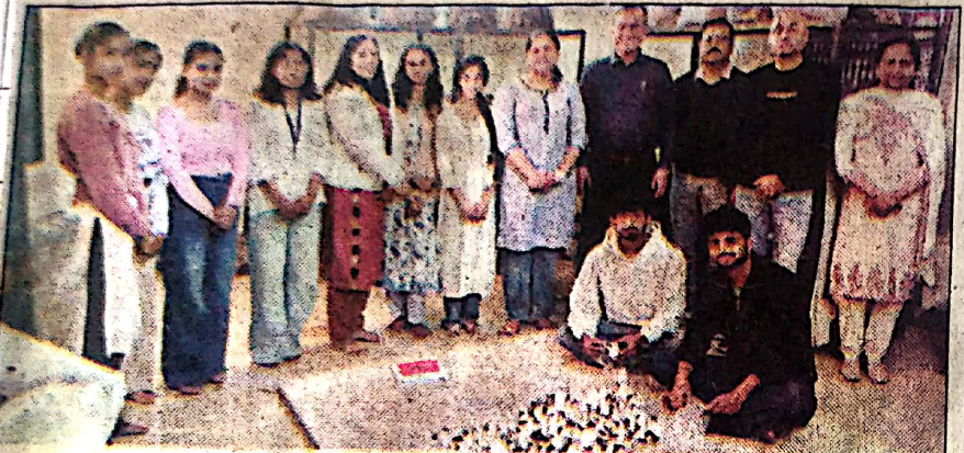
पालमपुर: कार्यक्रम के दौरान बटन मशरूम की तैयार की गई उपज दिखाते छात्र